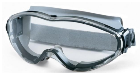
B Gogle ochronne