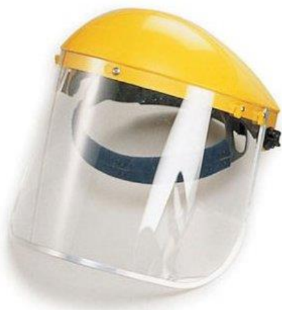
C Osłona twarzy