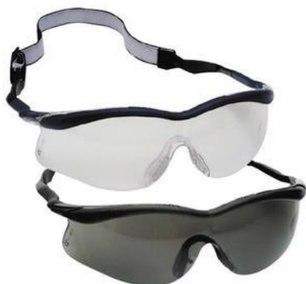
A Okulary ochronne