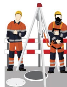
Rys. 3. Aparaty ratunkowe uciezkowe