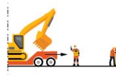
Rys. 3. Kierowanie ruchem pojazdów