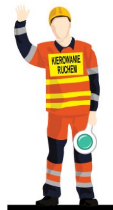
Rys. 4. Kierujący ruchem