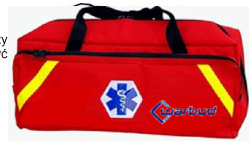
Rys. 4. Przenośny zestaw pierwszej pomocy