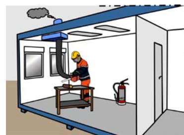
Rys. 3. Instalacja wyciągowa dla narzędzi spalinowych stosowanych wewnątrz pomieszczeń zamkniętych