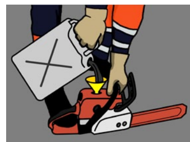
Rys. 2. Prawidłowy sposób uzupełniania paliwa w narzędziach spalinowych