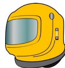
Rys. 3. Hełm do piaskowania