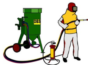
Rys. 2. Piaskowacz – wyposażenie ochronne