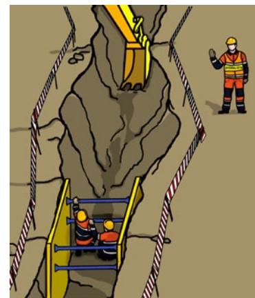
Rys. 4. Prace w wykopach wąskoprzestrzennych