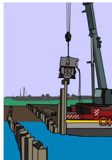
Rys. 5. Stabilizacja maszyny na podłożu podmokłym i bagnistym