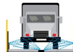
Rys. 3. Myjnię dla pojazdów budowy