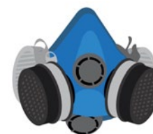
Rys. 2. Półmaska ochronna z pochłaniaczami