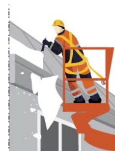
Rys. 4. Usuwanie śniegu z elementu budynku przez pracownika w podnośniku koszowym