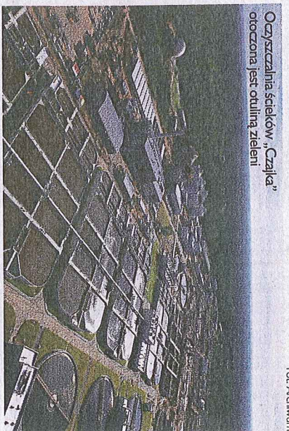
Oczyszczalnia ścieków „Czajka” ooczyszczona jest otulina zieleni