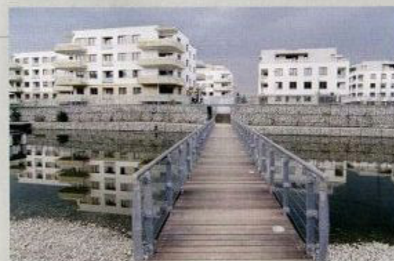
Osiedle Marina Mokotów w Warszawie